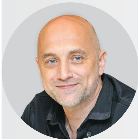
Захар ПРИЛЕПИН, сопредседатель партии:

— Это будет важнейшим шагом по ликвидации бедности в нашей стране. Если люди будут получать эти деньги от государства, деньги справедливые, в том числе благодаря справедливому распределению той же самой природной ренты, то ситуация будет меняться к лучшему.