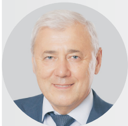
Анатолий АКСАКОВ, председатель Комитета Госдумы по финансовому рынку:

— Эти пресловутые 10 тысяч рублей, которые наша партия предлагает с января 2022 года уже выплачивать, они, во-первых, в нашем государстве есть, во-вторых, они действительно несут не только социальную нагрузку, когда человек получает возможность потратить это на свои базовые потребности. Они несут еще нагрузку такого патристического-философического свойства, потому что это действительно прекрасно, что человек, тем более ребенок, получает деньги просто за то, что он родился в России. Надо осмыслить это, как это замечательно и удивительно: тебе повезло, ты родился в удивительной, прекрасной, богатой, с тысячелетней историей стране, которая просто так рада, что ты родился, что тебе будет давать 10 тысяч рублей.