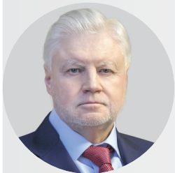
Сергей МИРОНОВ, лидер партии:

— СБД — это не просто раздача денег, это инвестиции в человеческий капитал, которые вернутся сторицей через рост ВВП, так как будет совершенно другая производительность труда, другое мышление, совершенно другое здоровье у людей, будет большая отдача, и это подтверждает опыт других стран.