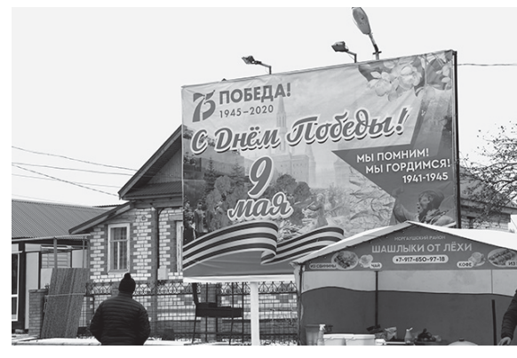
...а так – Парк Победы в Моргаушах.

– Насколько мне известно, деньги на реконструкцию Парка Победы в Моргаушах выделены в рамках федеральной программы «Формирование комфортной городской среды». Это есть правительство регионам дает деньги и как бы говорит: «Вот вам финансовые средства. Ваша задача – эффективно их освоить». Но с эффективностью возникают проблемы. Одна из причин – недостаточный контроль за освоением средств со стороны муниципалитетов. Сложилась такая система, что они будто ни за что не отвечают. Объект не сдан в срок? «Так не мы же виноваты, – говорят они, – Подрядчик подвел, недобросовестный оказался. А мы при чем? Он тендер выиграл». Именно так произошло с ремонтом школы в Вурнарах. Идешь разбираться к подрядчику. А у него свои претензии: по ходу работ пришлось вносить изменения в проект, так как он некачественный, к тому же смета составлена неправильно... И так до бесконечности. Мне кажется, пора разорвать этот порочный круг.