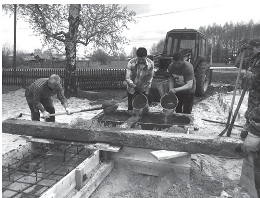
Так реконструировали сквер в п. Первомайский,

Уходящий год был знаменателен прежде всего 75-летием Великой Победы. Хоть пандемия несколько и омрачила радостный настрой россиян и внесла свои коррективы в сценарии проведения празднования, но к этой дате регионы, включая и Чувашию, подготовились основательно. В частности, почти во всех районах и городах республики были либо реконструированы, либо приведены в порядок парки, скверы, заложенные в честь Победы, как, например, в Чебоксарах, Вурнарах, в Красных Четаях и других муниципальных образованиях. В п. Первомайский Алатырского района установили вертикальную мемориальную доску из гранитных плит в виде раскрытой книги, куда внесли фамилии земляков, погибших в Великой Отечественной войне, памятную плиту