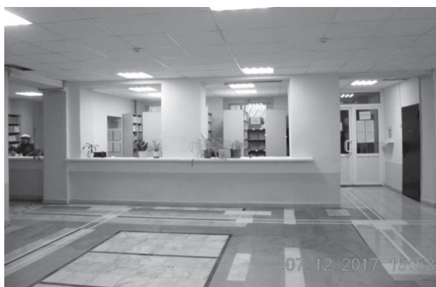
Подготовлено по материалам СМИ и Интернет-сайтов

ганизация зоны регистрации поможет создать комфортную и доступную среду для пациентов поликлиники, сократить очереди и время оформления записи на прием к врачу, оптимизировать логистику движения пациентов.