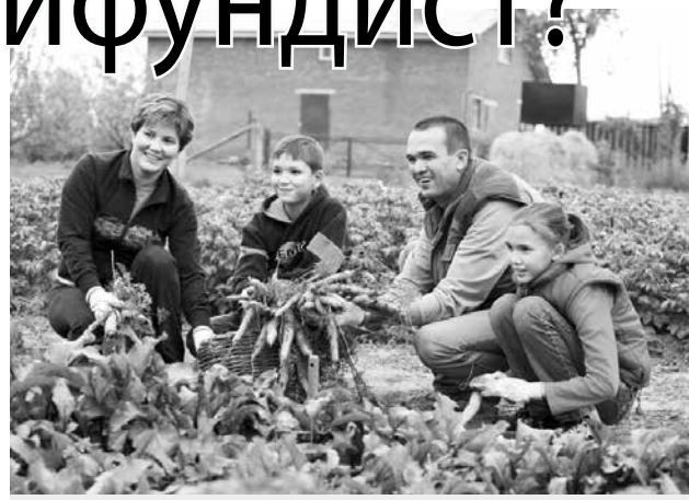
Этот вдохновляющий снимок с морковками обошел весь Интернет.