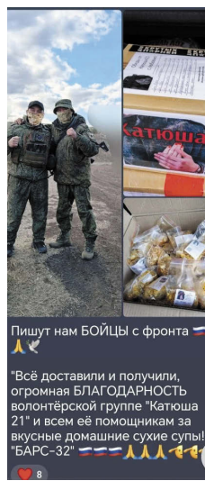
Пишут нам БОЙЦЫ с фронта "Всё доставили и получили, огромная БЛАГОДАРНОСТЬ волонтерской группе "Катюша 21" и всем её помощникам за вкусные домашние сухие супы!" "БАРС-32"

Очень радуют женщин отклики бойцов, которые регулярно пишут в сообщество. «После ваших отзывов открывается второе дыхание!» – отвечают ребятам женщины.