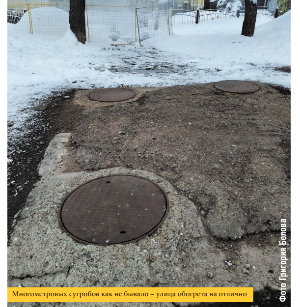
Многочисленных ступов как не бывало – улица обогрета на отлично