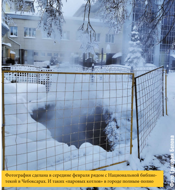
Фотография сделана в середине февраля рядом с Национальной библиотекой в Чебоксарах. И таких «паровых котлов» в городе полным-полно

Утечки тепла – кто их оплачивает? Потребители, поскольку потери заложены в тариф.