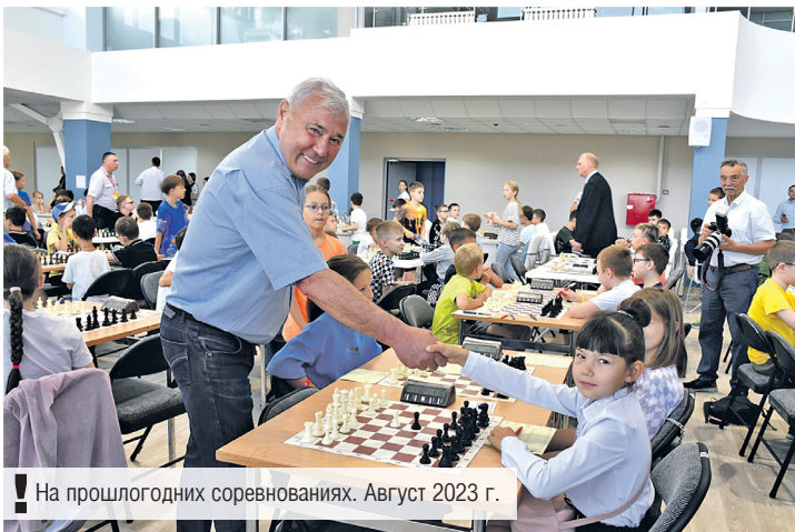
На прошлогодних соревнованиях. Август 2023 г.