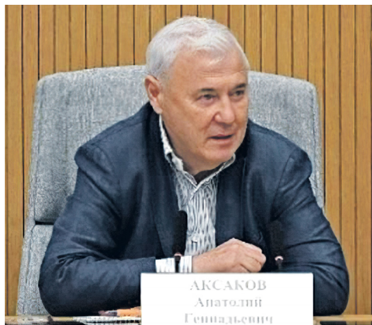
АКСАКОВ Анатолий Геннадьевич

Председатель Комитета Госдумы по финансовому рынку Анатолий Аксаков вместе с главой Республики Башкортостан Радием Хабировым 12 июля провел круглый стол на тему «Формирование финансовой культуры граждан: перспективы, вызовы и точки роста».