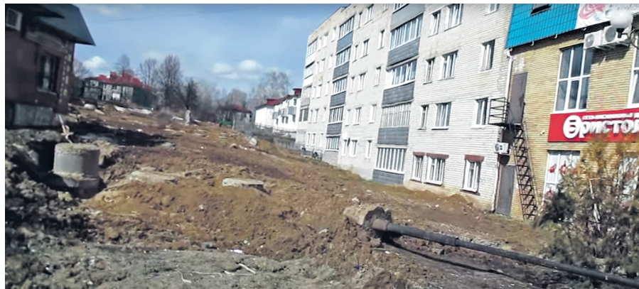
Ул. 30 лет Победы. Новые трубы здесь проложены. А благоустройство... И так почти по всей Козловке. Рабочие здесь замечены не были. В общем, судите сами: все, что видно на фото, можно считать городской достопримечательностью.