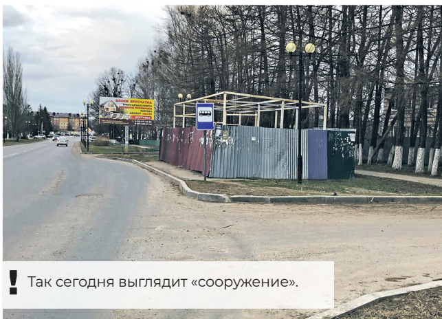
! Так сегодня выглядит «сооружение».

– За это однозначно должна ответить управляющая компания. Завтра мы сходим туда, поговорим с жильцами и оформим соответствующее обращение. В любом случае это дело мы просто так не оставим.