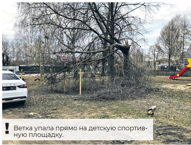
! Ветка упала прямо на детскую спортивную площадку.