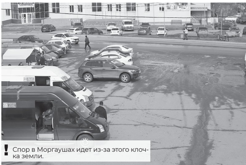
! Спор в Моргаушах идет из-за этого клочка земли.