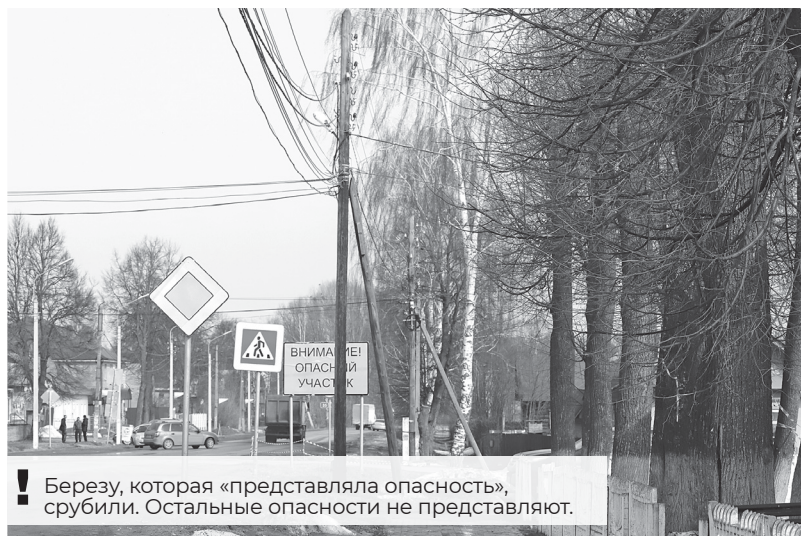
! Березу, которая «представляла опасность», срубили. Остальные опасности не представляют.