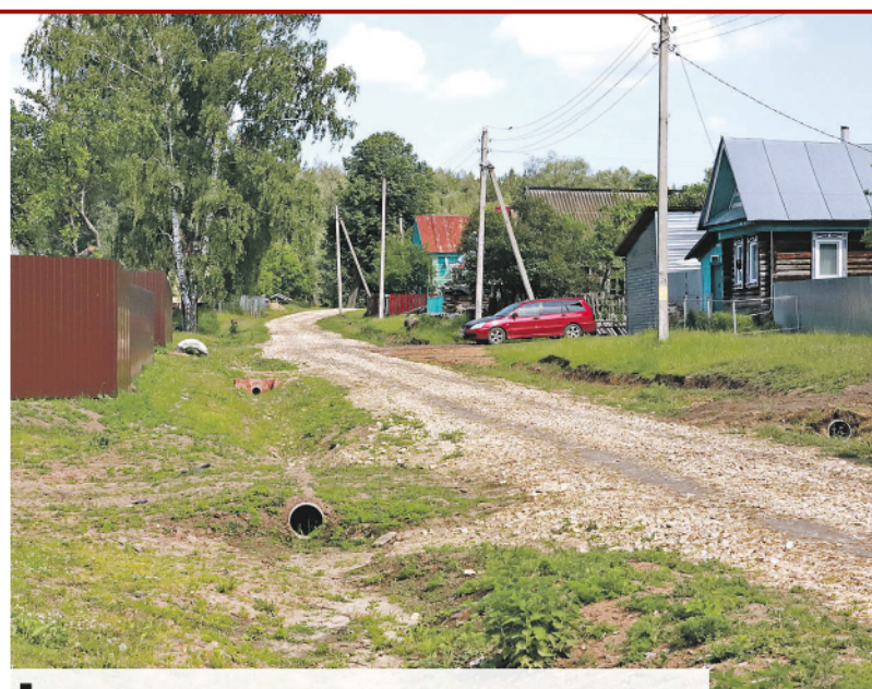
Жители улицы Лесной устроили праздник в честь завершения строительства дороги.