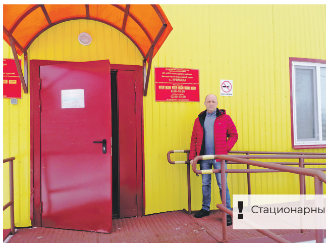
! Стационарный ФАП в с. Ичиксы.