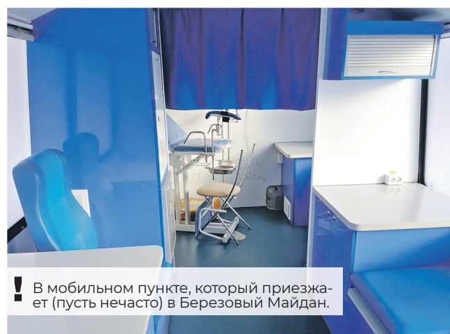
! В мобильном пункте, который приезжает (пусть нечасто) в Березовый Майдан.