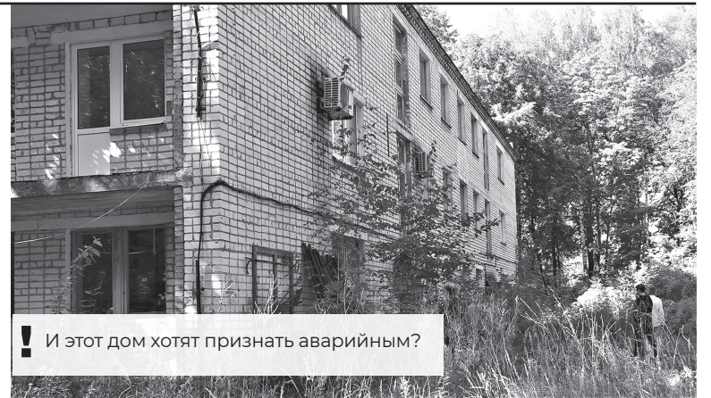
И этот дом хотят признать аварийным?

Но как определить эту пресловутую рыночную стоимость? Коммерческая компания предлагает ис-