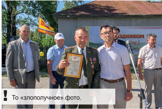
То «злополучное» фото.