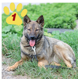
1 Чудесная Малышка, около 9 месяцев

Помочь оплатить уход, содержание, лечение, стерилизацию — карта СБ 4276 7500 2448 8925 на имя Натальи Викторовны В.