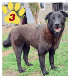
3 Брюнет Дюша, около 7 месяцев

Мирра — самая добрая и покладистая собака на свете. И это не реклама. Любимица многих волонтеров, потому что рада каждому человеку. Молодая, среднего размера, типаж терьера. Подойдет всем, кому не хватает любви, так как Мирра — это огромное сердце в собачьей шкуре!