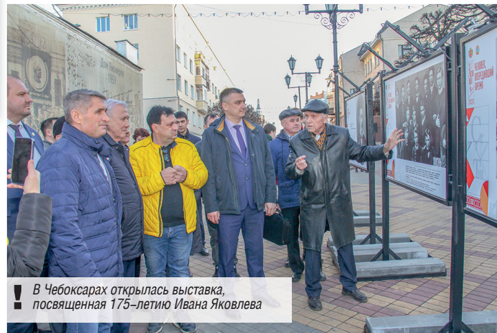
! В Чебоксарах открылась выставка, посвященная 175-летию Ивана Яковлева

Чувашская делегация побывала в Ульяновском государственном педагогическом университете, ознакомилась с экспонатами в музее «Симбирская чувашская школа. Квартира И.Я. Яковлева».