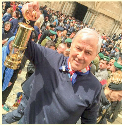
Анатолий Аксаков, депутат Госдумы РФ, председатель Совета регионального отделения партии СПРАВЕДЛИВАЯ РОССИЯ – ЗА ПРАВДУ