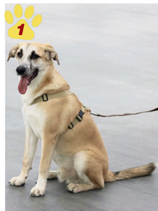
Дружелюбный Эмир, 6 месяцев

Публикуя фото собак и коротко рассказывая о них, мы очень надеемся на добрых людей, способных дать бедолагам дом и заботу. Мы знаем, что они в долгу не останутся.