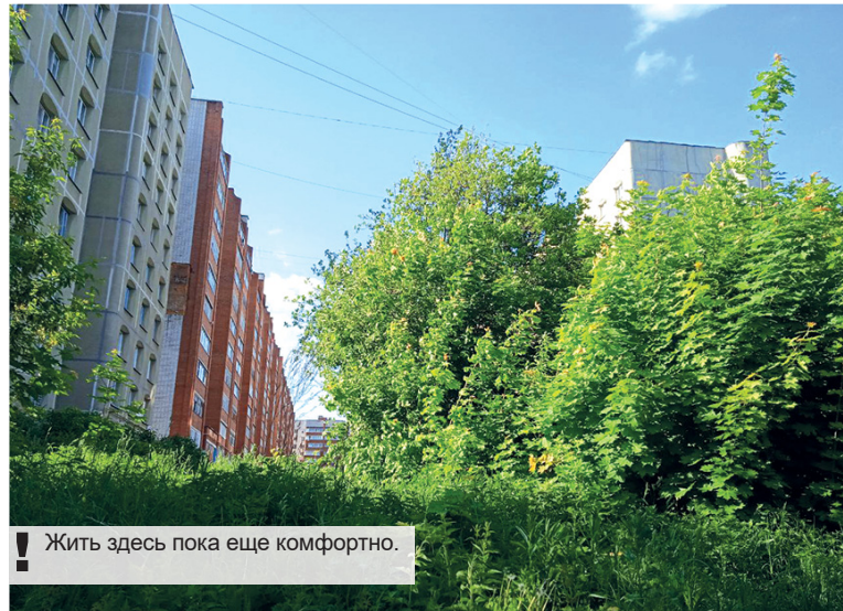
Жить здесь пока еще комфортно.

Опять дословно: «Под застройку в прошлом году были защищены ин-