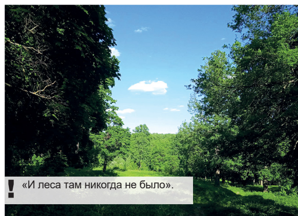
«И леса там никогда не было».

Замечания говорят о недоработанности проекта. Однако практика показывает, что застройщики всегда добиваются своего. Много было историй в Чебоксарах,