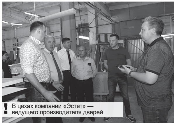
В цехах компании «Эстет» — ведущего производителя дверей.

Реконструкция исторической части города, где планируется открыть аж семь музеев, приоритет? Конечно! Строительство инфраструктуры в микрорайоне «Южный-2» приоритет? Еще какой! Возрождение хмелеводства в районе приоритет?