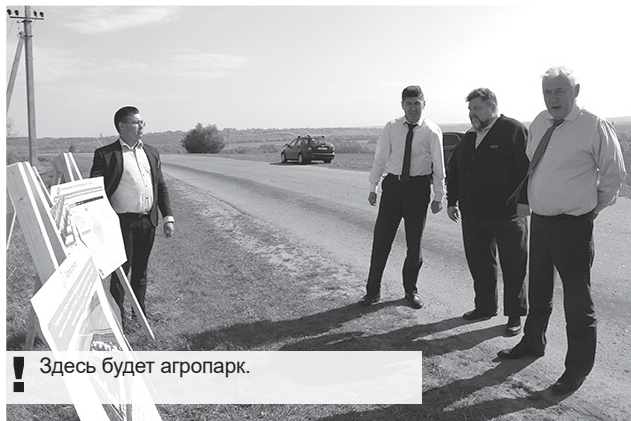
Здесь будет агропарк.

ней власти в Чувашии было затрачено чуть ли не сто миллионов рублей, и все впустую. За эти годы оборудование полностью пришло в негодность, и восстановлению БОС не подлежит. Значит, надо строить по новой, начиная с самых низов – с проектирования.