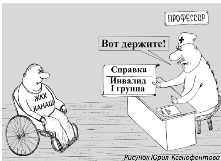
Рисунок Юрия Ксенофонтова

В УК не бывает денег на зарплату слесарям, уборщицам и другим низкооплачиваемым работникам. Нет, зарплату они получают, но не в установленном порядке. Жильцы дома собирают квитанции и отдают их уборщице, она платит по ним и этими деньгами получает заработанные деньги. Корешки приносит жильцам. Если же жильцы дают только квитанции, уборщица идет с ними к бухгалте-