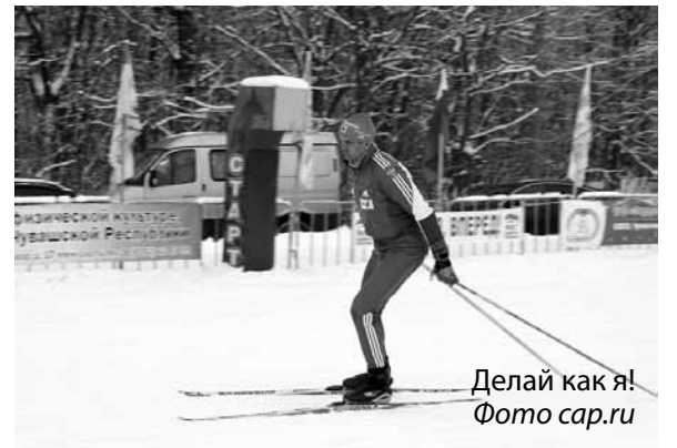
Делай как я!

их высказываний в жизнь. Ведь пока единственное «достижение» при новом главе – вхождение Чувашии в тройку самых коррумпированных регионов страны (по версии Public.Ru).