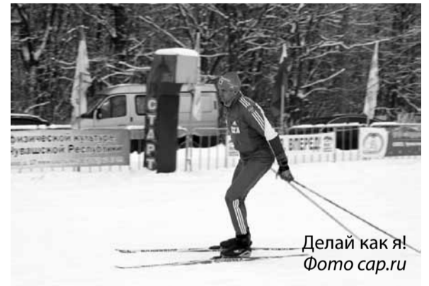
Делай как я!

их высказываний в жизнь. Ведь пока единственное «достижение» при новом главе – вхождение Чувашии в тройку самых коррумпированных регионов страны (по версии Public.Ru).