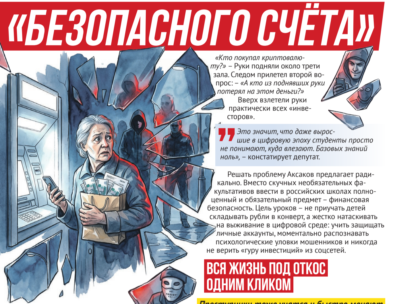
Иллюстрация: Елена Пантелеева

МВД Чувашии сообщило, что схема с «безопасным счетом» до сих пор одна из самых опустошительных. Только за январь – март текущего года в республике на нее попались 116 человек, которые отдали аферистам 104 миллиона рублей. Но если одни попадают из-за испуга, то другие – из-за жадности. 54-летняя сотрудница чебоксарской больницы познакомилась в Сети с обаятельным Максимом. Он не пугал, а звал в красивую жизнь: криптовалюта, надежные инвестиции, сверхдоходы. Женщина вложила первые 70 тысяч рублей. Потом еще. В итоге заложила собственную квартиру за четыре с половиной миллиона,